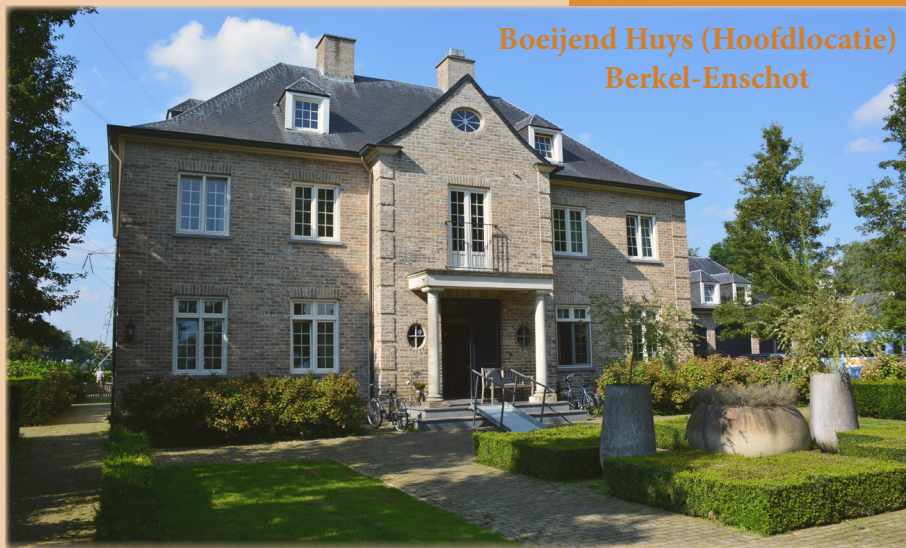
Boeiend Huys (Hoofdlocatie) Berkel-Enschot